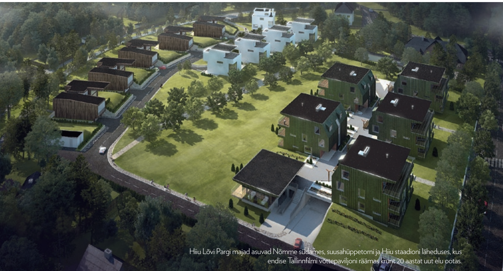
Hiiu Lõvi Pargi majad asuvad Nõmme südames, suusahüppetorni ja Hiiu staadioni läheduses, kus endise Tallinnfilmi võttepaviljoni räämas krunt 20 aastat uut elu ootas.

TEKST: SILVIA PÄRMANN